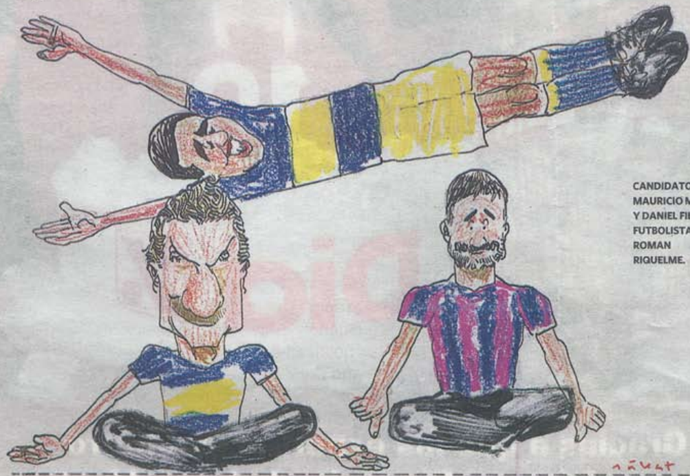
CANDIDATOS MAURICIO MACRI Y DANIEL FILMUS, FUTBOLISTA JUAN ROMAN RIQUELME.